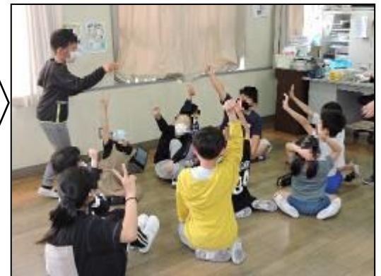
【6年生のリードでふれあう様子】

4月27日(水)本校の特色である縦割り活動1回目の「顔合わせ集会」が行われました。20の絆グループは6年生をリーダーとして、自己紹介からスタートしました。今後、年間を通してふれあいを深め、共感的な人間関係づくりを進めていきます。